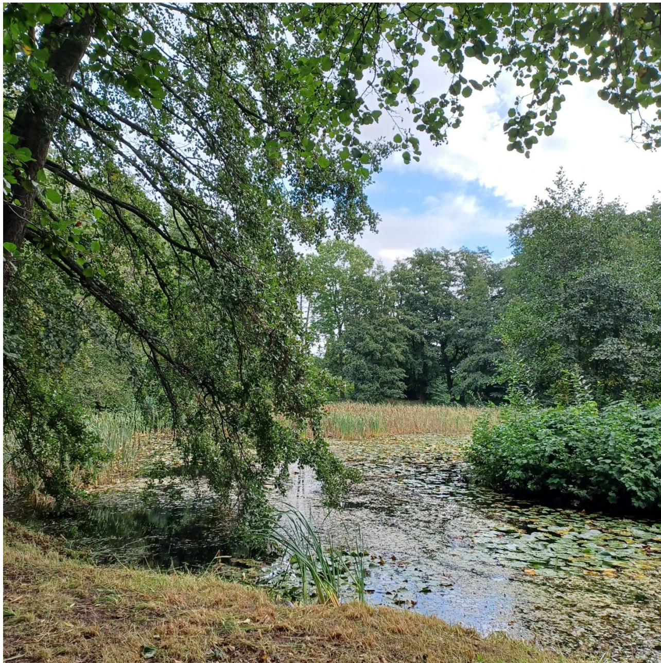
Bild 2 Dammen hösten 2024