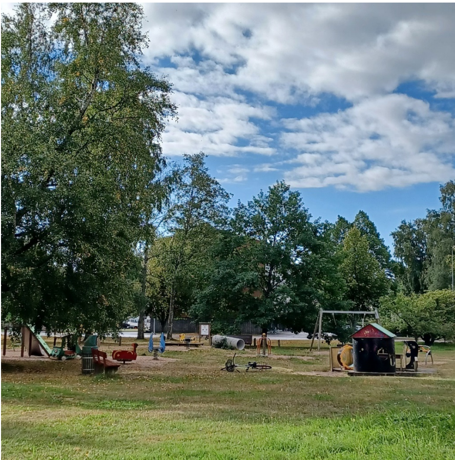
Bild 4 Lekområdet i Haga park, hösten 2024