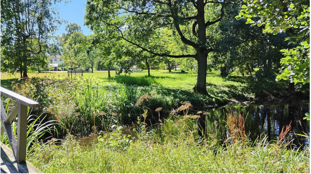
Bild 1. Haga park, 2024 på hösten