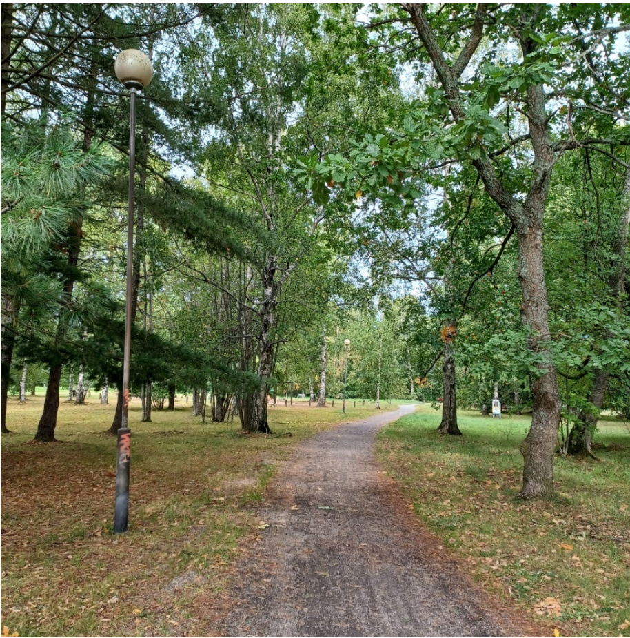
Bild 3 Lättrafikleden i Haga park, hösten 2024