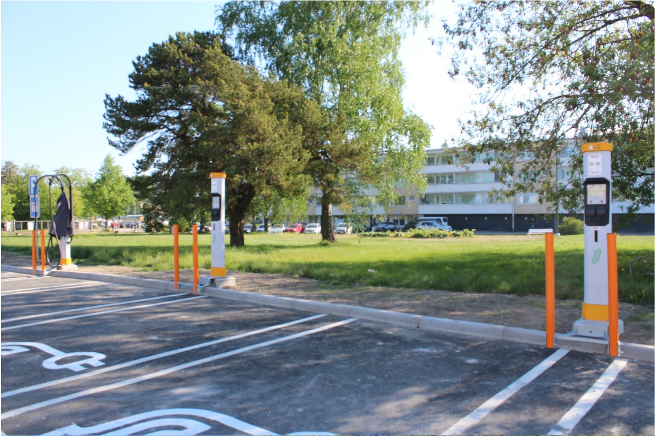
Bilderna 2, 3 från Stationstorget