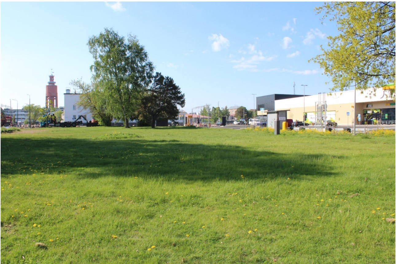
Bild 1. Bild över Stationstorget våren 2024

Stationstorget är idag en öppen, enkel park med några bänkar, ett planteringsområde med låga perenner, träd och gräsmatta. Ett tiotal större träd växer längs kanterna av Stationstorgets park. Det finns 3 stora björkar på Brandkårgatans sida och 2 stora ekar på Esplanadens sida. Bredvid stationsbyggnaden växer en tall och några ädelträd, asklönnar. De vackra barrträdsplanteringarna blev under vägen och parkeringsplatsen till det byggda köpcentret.