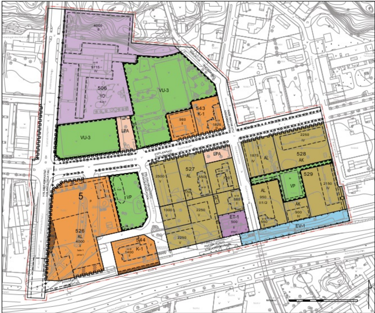
Bilderna 4, 5 Stationstorgets detaljplan och gatuplan