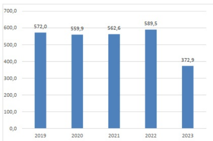
Kuva 4 Henkilötyövuodet 2019–2023 Bild 4 Årsverken 2019–2023